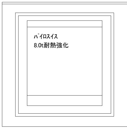
正面図:室内側より